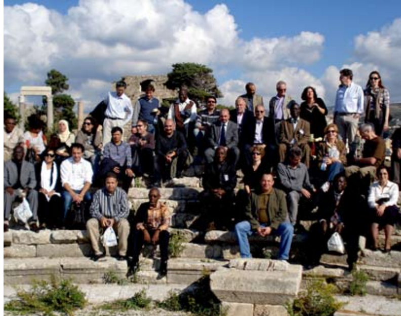
Partie du groupe à Byblos