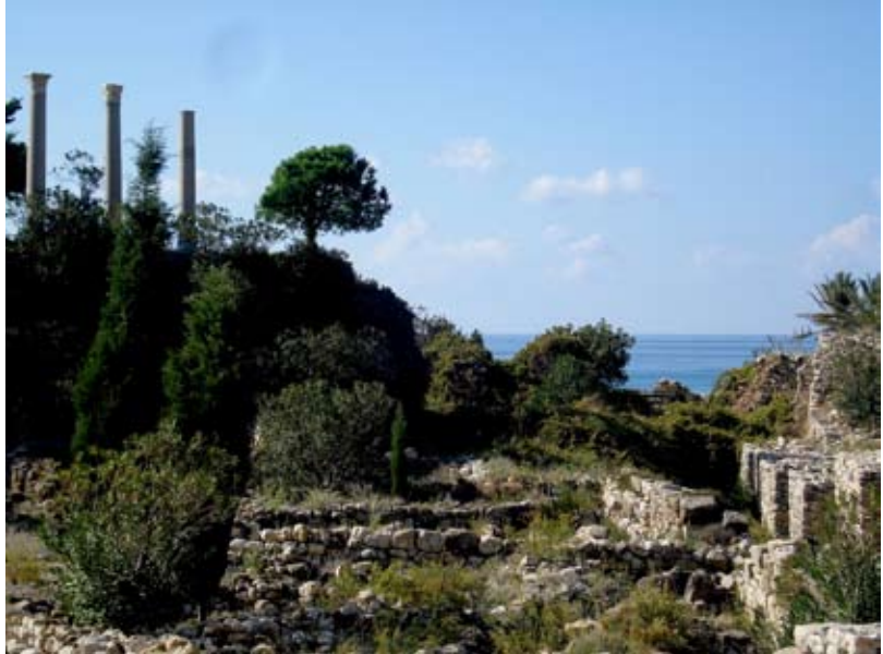
La mer à Byblos