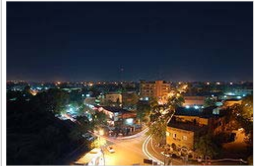
Niamey - vue nocturne