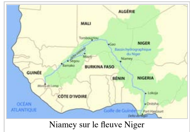
Niamey sur le fleuve Niger