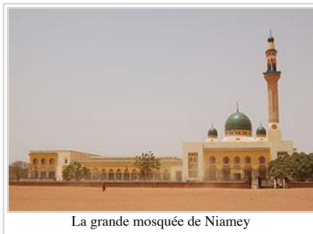
La grande mosquée de Niamey