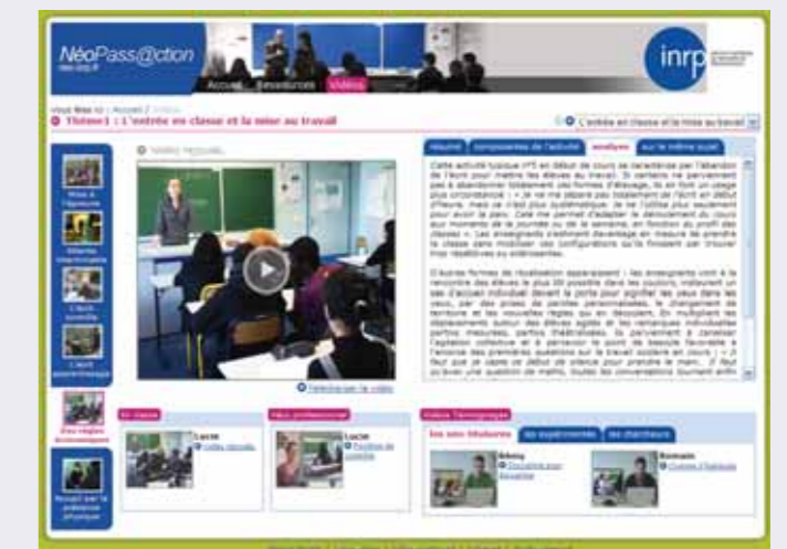
Plateforme de ressources en ligne « NéoPass@ction » pour la formation des enseignants en France développée à partir des travaux de recherche du Laboratoire PAEDI

Le laboratoire PAEDI bénéficie d'une reconnaissance nationale et internationale dans le domaine du travail enseignant, des éducations à la santé publique, de la formation des enseignants :