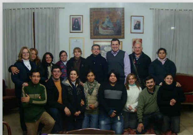
May 2013 Tucumán (ARG)