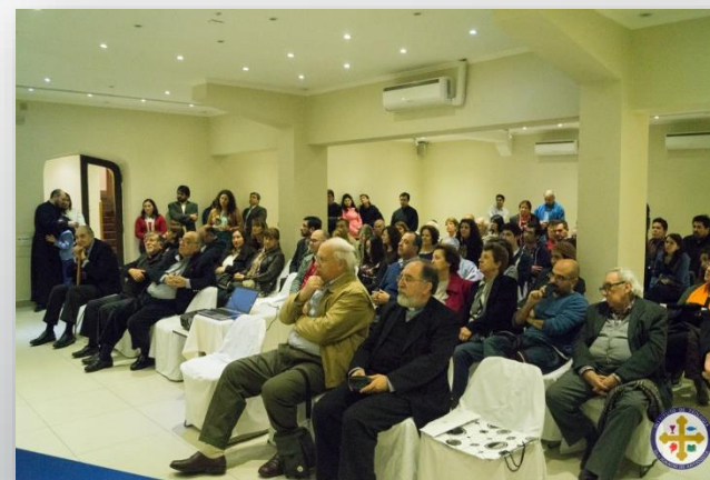
September 2014 Santiago (CHL)