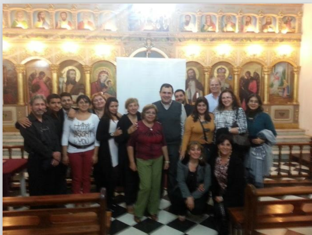
May 2013 Salta (ARG)