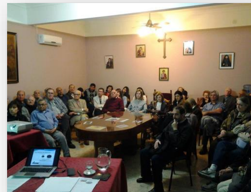
September 2014 Buenos Aires